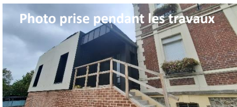
Photo prise pendant les travaux

En recherche de solutions pour pérenniser son implantation territoriale, la Poste s'appuie sur les communes et les