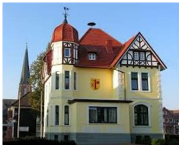
- Mairie de Dinklage -

Pendant la période de déconstruction de l'usine qui s'est déroulée entre 2016 et 2018, des artistes ont laissé libre cours à leur imagination en créant des œuvres éphémères. Des reproductions seront présentées au public, lors de la visite exceptionnelle du 7 septembre (p.1).